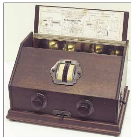
Der Telefunken T4, ein Zweikeiser für Mittel- und Langwelle aus dem Jahr 1927

die Zeit reif, dem Radio und der zu Ende gehenden Röhrenära ein Museum zu widmen. Allerdings teilten die auf Räumlichkeiten angesprochenen Verwaltungen und Behörden nicht die Euphorie Neckers und hielten die Idee eines Radiomuseums für