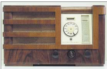
Aus der Stadt Kiel stammt dieser Empfänger der Firma Neufeldt & Kuhnke (heute Hagen): Der Nordmark Wählscheiben-Super, ein Oktodensuper für Mittel- und Langwelle aus dem Jahr 1936. Die Abstimmung wurde mittels einer Telefonwählscheibe vorgenommen und jeder Senderfrequenz war eine zweistellige Zahl zugeordnet. Bei einem Preis von 236 Mark war der Empfänger für die Mehrheit der Radiohörer unerschwinglich.

Der erste deutsche Rundfunksender wurde am 29. Oktober 1923 von Hans Bredow im Berliner Vox-Haus seiner Bestimmung übergeben. Das war die eigentliche Geburtsstunde des Rundfunks in Deutsch-