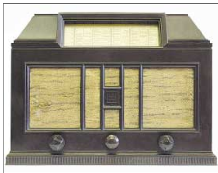
Der Telefunken „Admiral 346 WL“, ein Dreikreiser mit Mittel- und Langwelle von 1933 für beachtliche 263 Reichsmark.

Nach 1945 bauten findige Radiobastler aus den wenigen noch vorhandenen Materialien teils abenteuerlich anmutende Notempfänger, die man etwa in eine Zierlampe integrierte. Grundig brachte 1947 seinen Rundfunkbaukasten heraus, den berühmten Heinzelmann , und legte damit einen Grundstein für das Unternehmen, das in den Folgejahren zu den führenden Herstellern von Unterhaltungselektronik gehörte.