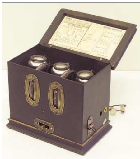
Telefunken Arcolette III W, ein Einkreiser für Mittel- und Langwelle aus dem Jahr 1928

Sender, was als schweres Vergehen galt und mit der Todesstrafe geahndet werden konnte.