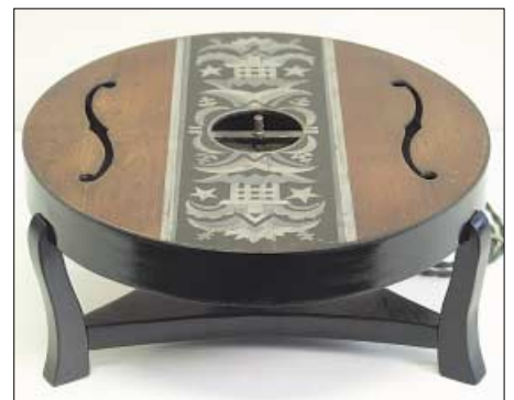
Edles Zubehör für Audiophile Radiohörer: der Lautsprecher Tonspiegel des Klavierbauers Ibach aus dem Jahr 1924

Der Volksempfänger kam Ende 1933 auf den Markt und kostete stolze 76 Reichsmark. Eigentlich war zu diesem Zeitpunkt längst der Superhet-Empfänger erfunden und etwa in den USA verbreitet; frühe Modelle gab es schon in den 20er-Jahren. Doch wurde diese teure Empfangstechnik den Radiohörern in Deutschland bewusst vorenthalten, auch um den Empfang so genannter Feindsender, wie BBC und Radio Moskau, zu verhindern. Dennoch gelang mit etwas Können und Fingerspitzengefühl auch mit den vorhandenen Radiogeräten der Empfang ausländischer