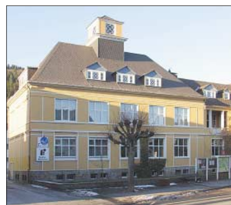
In diesem Gebäude, dem „Haus der Jugend“, hat das größte Radiomuseum der Welt, seine feste Bleibe gefunden.

die Zeit reif, dem Radio und der zu Ende gehenden Röhrenära ein Museum zu widmen. Allerdings teilten die auf Räumlichkeiten angesprochenen Verwaltungen und Behörden nicht die Euphorie Neckers und hielten die Idee eines Radiomuseums für