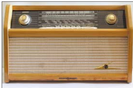
Der Loewe Opta „Hermes“ 5742W – ein Super mit UKW, MW, LW sowie zwei KW-Bereichen aus dem Jahr 1959 für damals stolze 319 Mark

Obwohl die damaligen Radiogeräte für ein technisch nicht geschultes Publikum konzipiert waren, verlief das abendliche Empfangsvergnügen der vor dem Apparat versammelten Familie nicht immer problemlos: War die Empfangsantenne einmal zwischen zwei Häusern gespannt, hatten die Techniknutzer noch immer mit einem Gewirr von Kabeln sowie einer Vielzahl von Hebeln und Drehscheiben zu tun.