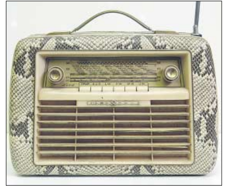
Dieser edle Koffersuper, der Loewe Opta Lord für UKW, KW, MW und LW, mit Schlangenlederbezug aus dem Jahr 1956 war noch mit Röhren bestückt. Die zum Betrieb notwendigen Anodenbatterien hielten nicht lange. Das Gerät kostete damals 259 Mark.

Bis Ende der 20er Jahre hatten sich in Deutschland der so genannte Ortsempfänger als Standard durchgesetzt, mit dem man hauptsächlich den örtlichen Radiosender hören konnte. Im Unterschied holten Fernempfänger auch die Signale entfernter Stationen ins Haus. Mit der erfolgreichen Einführung des preisgünstigen Ortsempfängers wandelte sich das Ra-