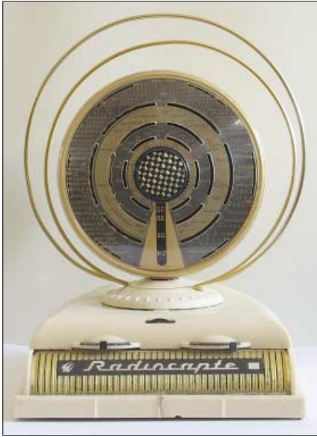
Der Radiocapte ist ein Superhet zum Empfang der Kurz-, Mittel- und Langwelle und wurde Mitte der 50er Jahre in Frankreich gebaut.

seine Stadt zu holen, und griff zu: Seit dem 31. März 1990 bietet das Radiomuseum in Bad Laasphe seinen Besuchern einen einmaligen Blick auf die Technikgeschichte des Radios.