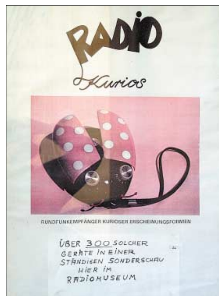
Die ständige Sonderschau Radio Kurios zeigt Radioempfänger in ungewohnter Form.

Zwei Sonderausstellungen zeigen zudem teilweise aufwändig konstruierte Rahmen-