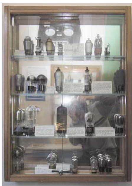
Etlche Glasvitrinen zeigen historische Radioröhren.

Als am 29. Oktober 1973 der Rundfunk in Deutschland fünfzig Jahre alt wurde schien